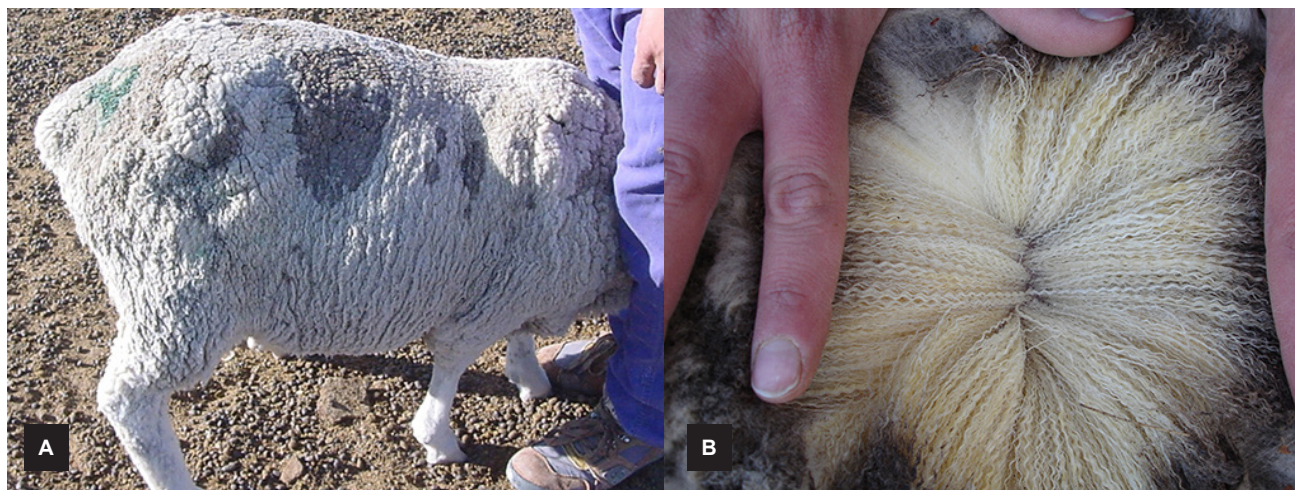
Figura 4. Dermatitis ovina por Corynebacterium bovis (lana sisal). (A) Aspecto macroscópico del vellón donde se puede ver un área grande y otras más pequeñas afectadas, de color oscuro y aspecto más denso. (B) Nótese las fibras de lana aglutinadas con aspecto de hilo sisal y coloreadas por un aumento en la cantidad de suarda (grasa de la lana) (C. Robles).