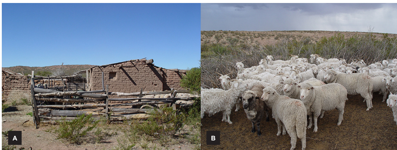
Figura 1. (A) Construcción típica de adobe de la vivienda familiar y los corrales para los animales construidos con palos y tablas de la zona. Nótese la ubicación de los corrales pegada a la casa. (B) Lote mixto de animales compuesto por ovinos Merinos y cabras Angora encerrados en un corral hecho con plantas arbustivas y ramas de la zona (C. Robles).

En cuanto a la realidad sanitaria del ganado de este sector es poco conocida, ya que en general no tienen acceso a los servicios veterinarios privados