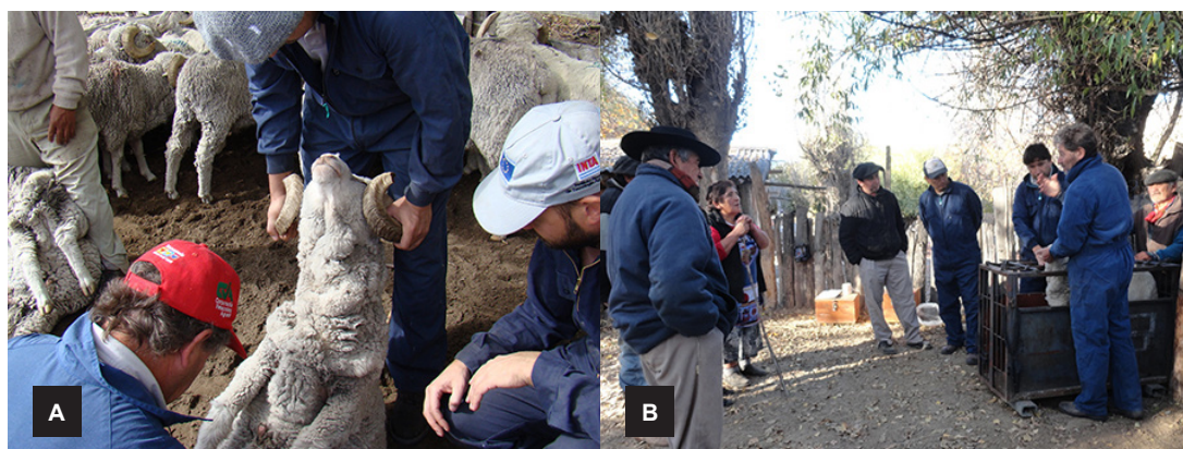
Figura 3. (A) Equipo de trabajo revisando clínicamente un carnero, en búsqueda de lesiones clínicas que orienten al diagnóstico de diferentes enfermedades. (B) Charla previa con la familia campesina donde se explica en qué consiste el estudio y cuáles serán los trabajos que se realizarán con los animales (C. Robles).