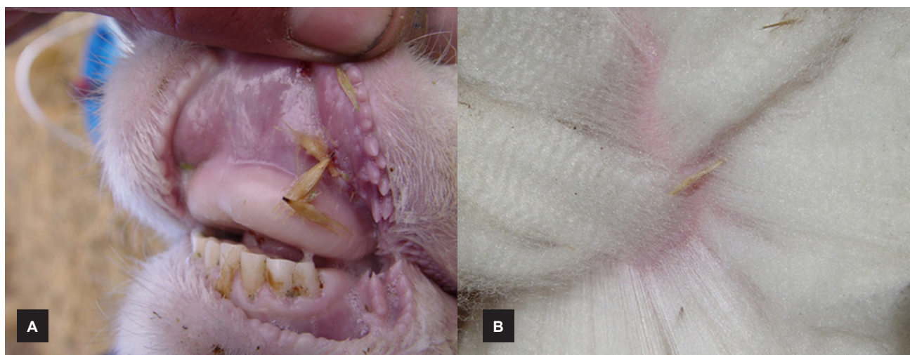
Figura 6. (A) Caso de “flechilla” donde pueden observarse las semillas de algunas gramíneas clavadas en la encía y mucosa bucal de un ovino. (B) Flechillas clavadas en la piel del animal (C. Robles).