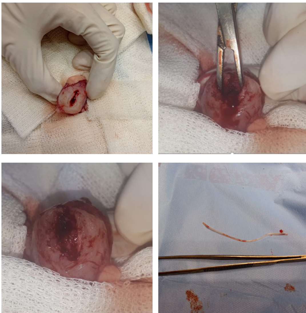
Figura 3. Imágenes del aspecto macroscópico de la vejiga, en el que se observa un aumento del grosor de la pared vesical y cuerpo extraño extraído en la cistotomía, en el caso 2.

Se estima que el gato, con sus intentos de sacarse la sonda uretral, llegó a cortarla con sus dientes liberando su anclaje externo, desplazándose la misma cranealmente para ubicarse en el trigono vesical, en la dilatación que lleva al orificio uretral interno. En su examen histopatológico se observó un aumento de la cantidad de fibras musculares y escasa vascularización, sin evidencia de depósito de fibras de colágeno, en los cortes histológicos mediante una tinción tricrómica de Masson (Figura 4).