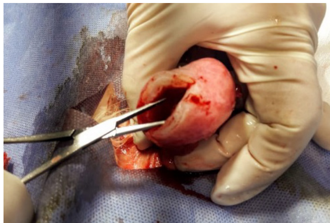
Figura 1. Imágenes del aspecto macroscópico de la vejiga del caso 1, se observa un considerable aumento en el grosor de la pared y con aspecto homogéneo.

(Figura 1). Al estudio histopatológico se observó escasa vascularización, fibras musculares aisladas y con una abundante distribución trabecular de fibras de colágeno, coloreado de azul en los cortes histológicos mediante una tinción tricrómica de Masson (Figura 2). Dicho patrón histopatológico es compatible con los casos de “vejiga de lucha” documentados en humanos y no descrito aún en patologías vesicales en felinos.