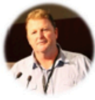
B. Hine (CSIRO, Australia)