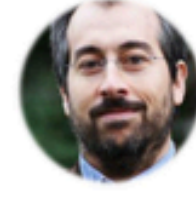
F. Salguero (UK Health Security Agency, UK)